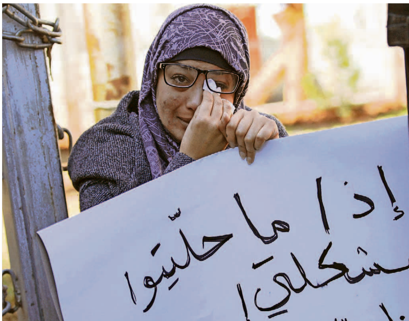
Die 25-jährige Palästinenserin droht mit ihrem Tod, wenn sie keine Medikamente bekommt.